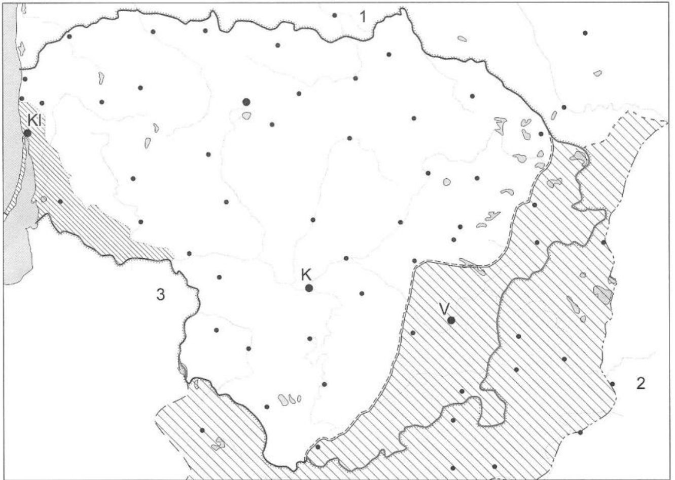
Lietuvos Respublika 1918 – 1939 m.