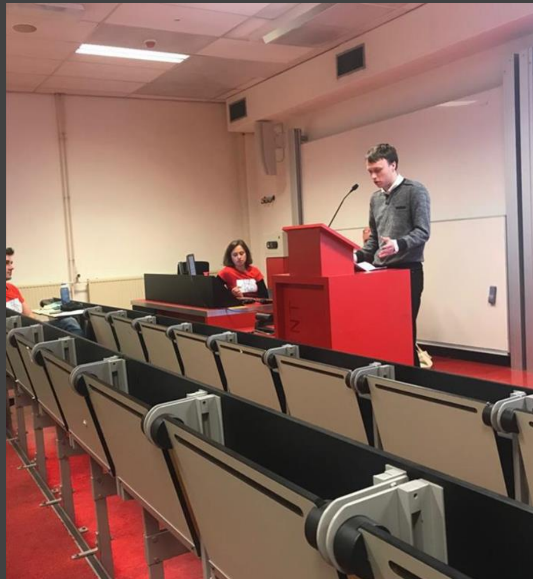
Gedimino Šataičio pranešimas